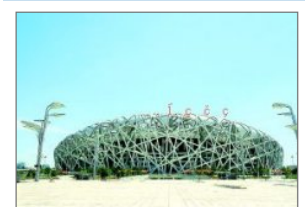
"科技奥运"向世界报告：奏响全